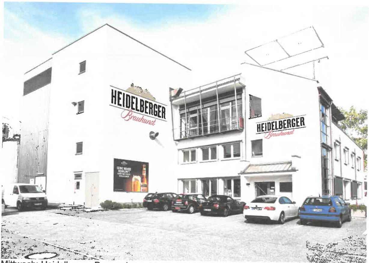
Mittwoch: Heidelberger Brauerei