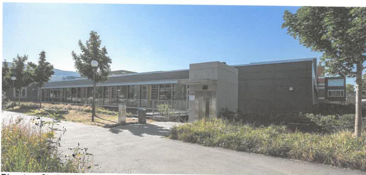
Dienstag: Stadtarchiv Heidelberg