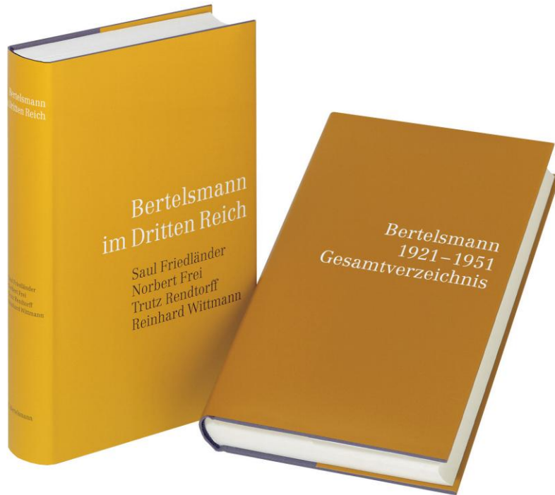
Bertelsmann im Dritten Reich C. Bertelsmann Verlag, 2002