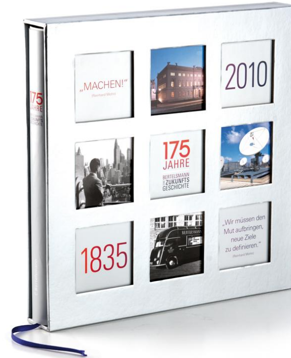
175 Jahre Bertelsmann - Eine Zukunftsgeschichte C. Bertelsmann Verlag, 2010