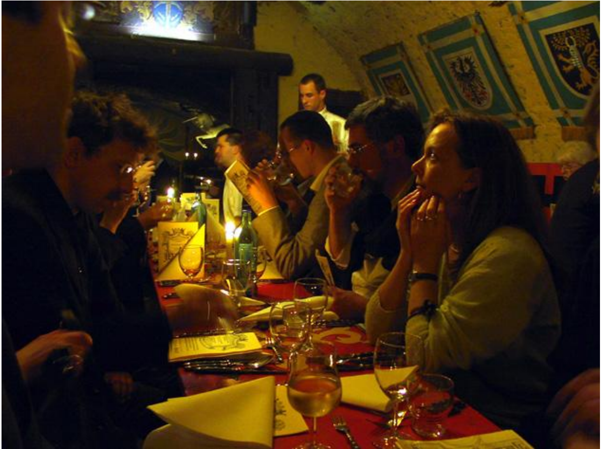
Kulinarische Expedition im "Gülden Schaf" zu Heidelberg.