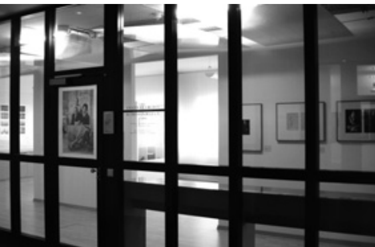
Das Zentralarchiv des Internationalen Kunsthandels e. V. ZADIK, Im Mediapark 7 in Köln.