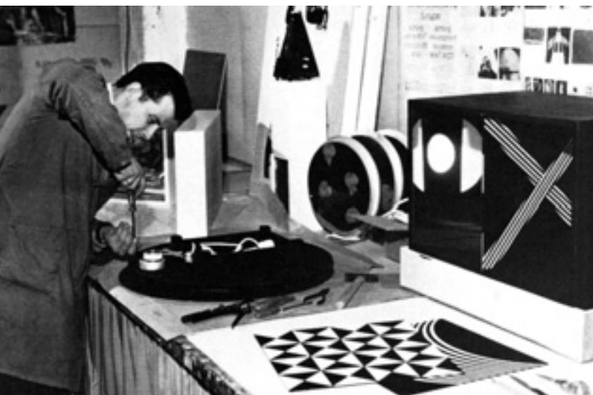
Ein Mitarbeiter der Spiegel-Werkstätten beim Bau eines Multiple, Anfang der 1960er Jahre.

Der älteste Bestand des ZADIK ist das Archiv der Galerien Thannhauser, die vor dem Zweiten