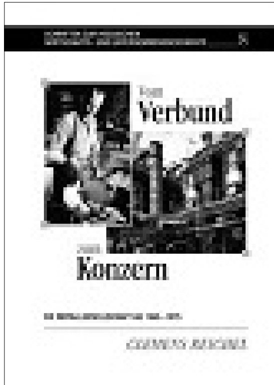
Publikation von Clemens Reichel über die Entwicklung der Metallgesellschaft AG nach 1945, erschienen in der Schriftenreihe des Hessischen Wirtschaftsarchivs

Material gewonnen werden können: Die besten Diagnosen stellt ja, normalerweise zumeist, der Pathologe, doch muss er eben das Material hierfür haben. Im Fall untergegangener Unternehmen gibt es aber in der Regel niemanden, der das Archiv bewahrt, da für herrenloses Schriftgut niemand einsteht, schon gar nicht finanziell. Aufbewahrung und Pflege der unternehmenshistorischen Sammlung setzen vielmehr ein lebendes, funktionsfähiges Unternehmen und eine insofern sensible Unternehmensführung voraus. Von erfolgreichen Unternehmen mit historisch sensiblen