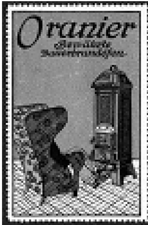
Reklamemarke der Frank'schen Eisenwerke, Dillenburg, für Dauerbrandöfen, vor 1914

gegen die auch der emsigste Archivar machtlos ist, ist zum Glück kein flächendeckendes Phänomen, und insofern besteht Hoffnung. Ein Blick in die lange Liste der Bestände des Hessischen Wirtschaftsarchivs bestätigt das. Diese Liste dokumentiert den umfassenden Charakter der Arbeit, der ja mit der Akquise der Bestände keinesfalls abgeschlossen ist. Erst durch ihre professionelle Verzeichnung werden die schriftlichen Hinterlassenschaften in einem strengen Sinn zu historischen Quellen, die die Forschung in ihrer Arbeit zu Grunde legen kann. Diese Liste, die sich bei den anderen regionalen Wirtschaftsarchiven in