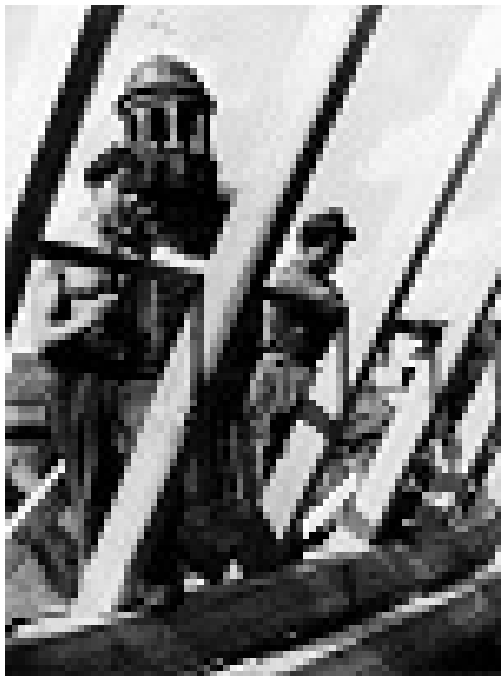
Wiederherstellung eines Dachstuhls am Frankfurter Rathaus im Rahmen der Wiederaufbaumaßnahmen in Frankfurt a. M. Im Hintergrund die wieder aufgebaute Paulskirche, um 1949 (Foto: Sepp Jäger / Hessisches Wirtschaftsarchiv)

oder Misserfolg, deren Voraussetzungen, Bedingungen und Folgen können in betriebswirtschaftlicher Perspektive klar skizziert werden. Nur existiert hier eine kategoriale Schranke, die diese Art der Literatur im Allgemeinen so lehrreich wie im Einzelnen so unergiebig macht. Denn in dieser Art Literatur wird ja nie das konkrete Unternehmen in den Blick genommen, sondern bestenfalls eine Art statistischer Blick entfaltet. So wenig uns nun freilich die Statistik der durchschnittlichen Lebenserwartung eine sichere Prognose der eigenen Lebenszeit ermöglicht, so sehr klären uns die Soziologie oder die Betriebswirtschaftslehre zwar über die Bedingungen der Möglichkeit von Erfolg im Wandel der Zeit auf, aber nie über den konkreten Erfolg oder Misserfolg, den sie wegen ihres statistischen Blicks gar nicht erfassen können. Weshalb ein Unternehmen scheitert oder Erfolg hat, kann hier bestenfalls vermutet oder für wahrscheinlich gehalten werden, über seine konkreten Probleme und Stärken und ihre jeweiligen Hintergründe erfahren wir wenig. So wenig nun