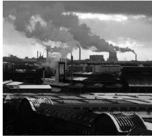
Industriegelände der ehemaligen Deutschen Waffen- und Munitionswerke im Berliner Bezirk Reinickendorf

Das Landesarchiv Berlin konnte nach dem Archivgesetz von 1993 auch das Schriftgut nichtstaatlicher Stellen übernehmen, soweit es im öffentlichen Interesse lag. Die IHK hatte in den 90er Jahren ihre